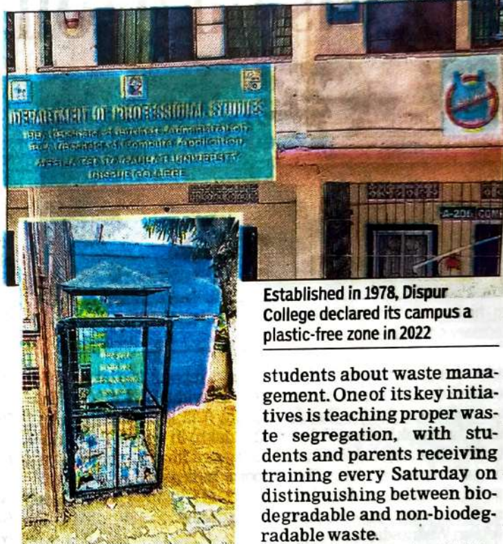
Established in 1978, Dispur College declared its campus a plastic-free zone in 2022

Beyond these institutions, Pandu College and Gauhati University are steadily making progress toward sustainability. Both have begun implementing eco-conscious practices, from reducing single-use plastics to promoting green alternatives in daily campus operations.